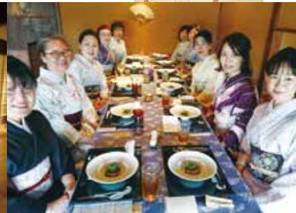
※写真は全てイメージです。

日時 2018年7月15日(日) 13:00～15:00 お申込み締め切り7月9日(月)